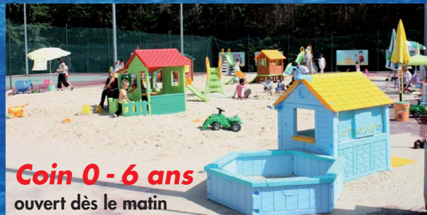
Coin 0 - 6 ans ouvert dès le matin

Nouveau : pataugeoire pour les moins de 6 ans avec un espace parents