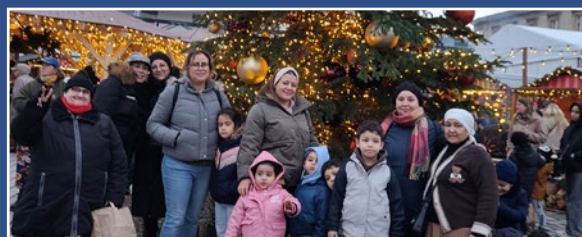
Marché de Noël de La Villette 22 décembre