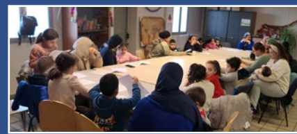
Contes & goûter d'hiver 31 décembre