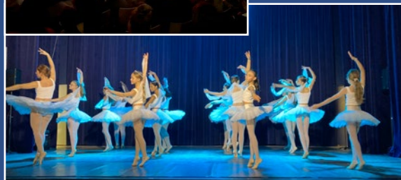
Spectacle « Un Noël fantastique » 3 décembre