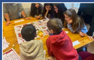
Ré-création Bee Bot « À la recherche du Père Noël » 17 décembre