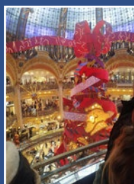
Sortie de Noël à Paris 29 décembre