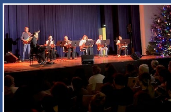
Spectacle Ballet « La Bayadère » 3 décembre