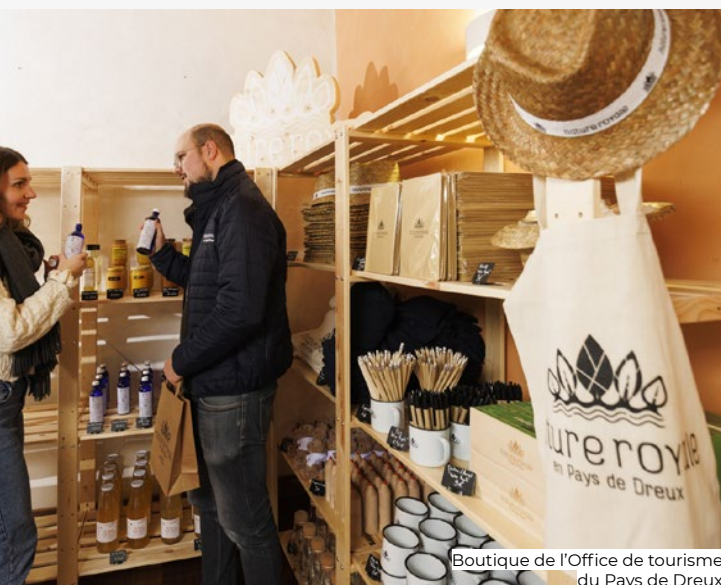
Boutique de l'Office de tourisme du Pays de Dreux

Depuis début 2025, de nouveaux points d'apport volontaire pour la collecte du verre fleurissent sur le territoire. Installés par l'Agglo du Pays de Dreux en concertation avec les communes, ils sont à la fois plus fonctionnels et facilement identifiables. D'ici 2027, le geste de tri pour le verre sera le même pour tous : le verre dans les points d'apport volontaire !