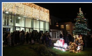
Lancement des illuminations et marché de Noël 5-6-7 décembre