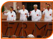
THÉÂTRE TOUT PUBLIC 1H05