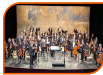
MUSIQUE ET DANSE TOUT PUBLIC 1H

Une poignée de résistants luttent contre La Firme, unique consortium agroalimentaire qui dirige aussi une milice privée qui fait appliquer les règles qu'elle édicte. Dans un période impossible à définir, 5 personnages déterminés et maladroits, cherchent à passer sous le manteau les dernières graines non traitées par la Firme. Clandestinement, ils cachent et tentent de distribuer au plus grand nombre ces précieuses reliques d'un période désormais révolue. C'est amusant, mais c'est quand même un peu la guerre !