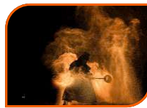
PYROTECHNIE TOUT PUBLIC 30 MINUTES

Asseyons nous, ou plutôt assoyons nous ensemble autour des travers de notre société contemporaine et son équilibre précaire.