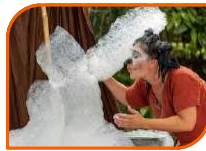
CLOWN-MARIONNETTE TOUT PUBLIC 40 MINUTES

Candide et maladroit, il partage avec le public son errance, entre désillusions, amour, clandestinité et espoir.