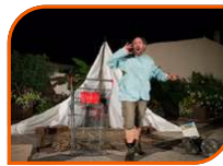
CLOWN-THÉÂTRE TOUT PUBLIC 50 MINUTES

L'orchestre symphonique de Chartres et Zest'Cie ont collaboré avec les jeunes des DAME de Champhol et Vernouillet pour créer un spectacle avec les corps sur des musiques de films joué en live par l'orchestre. De l'émotion, du poétique, de l'expression et de la belle musique pour ouvrir cette 6ème édition dans l'esprit du vivre ensemble.