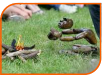
MARIONNETTE TOUT PUBLIC 15 MINUTES

Spectacle Hautement inflammable, Bâtons, cordes, massues, sabres et autres supports pour les flammes se mêlent et s'entremêlent avec virtuosité pour servir l'élément du feu et révéler sa magie .