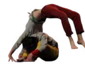
CIRQUE-ACROBATIQUE TOUT PUBLIC 45 MINUTES

Seul au volant de son caddie, et la tête pleine de cachetons Hamlet est à la recherche de son Ophélie après s'être enfui de sa chambre capitonnée. Il parcourt les rues avec ses amis imaginaires pour la retrouver. De prince à mendiant, il n'y a qu'un pas que la déraison a franchi. Le mendicore confond sa vie avec celle du prince déchu, et dans cette jolie jurieuse, confusionne les mots. Chaque jour il se met en scène au travers d'objets trouvés ici et là, pour trouver quelques sous pour Ophélie. Pris de folie émancipatoire, il parle à lui même, à tous