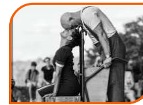
THÉÂTRE DÉAMBULATION TOUT PUBLIC 1H10