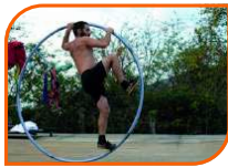
ROUE CYR-THÉÂTRE TOUT PUBLIC 50 MINUTES

Ils sont deux, ils s'adorent, ils sont un peu perdus mais ensemble ils avancent, et surtout : ils ne doivent pas se toucher. Ils sont touchants mais n'ont pas le droit de se toucher. Lorsque leurs corps s'expriment, s'opère un mélange entre adresse et tendresse. Ils voyagent dans les possibles de leurs deux corps sans se toucher, ou presque... Émerge une réflexion sur le contact, entre eux, entre vous, entre nous.